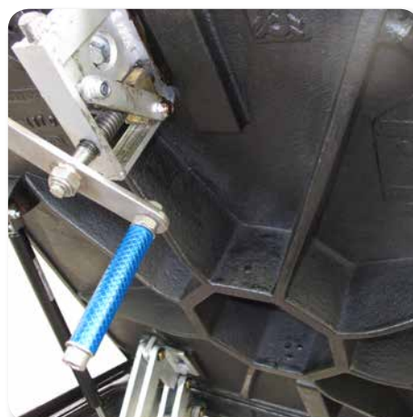
Spezialausführung Sonderbau: Flucht-Entriegelung für TETRA Schachtabdeckung