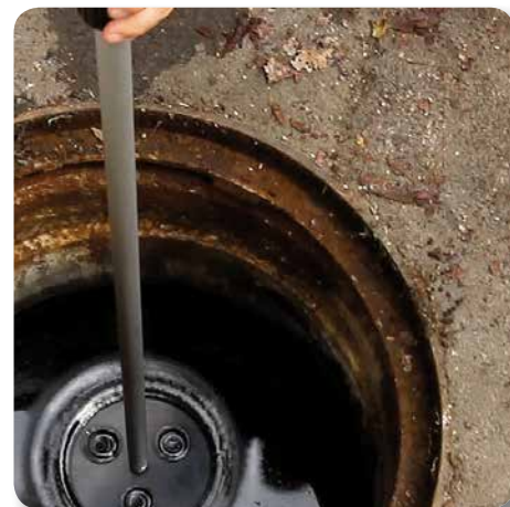
Sichtkontrolle der Abscheideroberfläche bei einem SeparatorBLUE