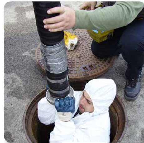
Schwierige Wartungsverhältnisse schrecken uns nicht ab!