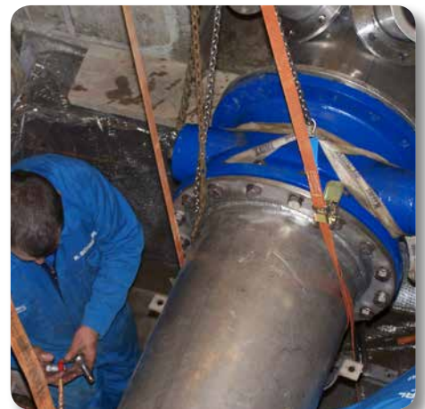
Montage einer großdimensionierten Pumpendruckleitung vor Ort

Technische Datenblätter Produktbeschreibungen Bemessungsformulare Formulare zur Bestandsaufnahme Ausschreibungstexte