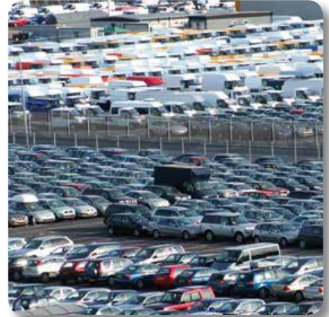
Aufgabe für Wallner & Neubert: Planen Sie hier eine Versickerungsanlage