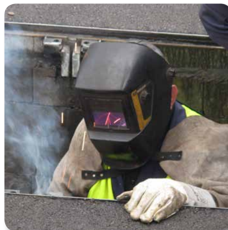
Sonderbau Mitarbeiter bei einer Deckelsanierung vor Ort

Gemeinsam mit der Konstruktionsabteilung und mit geeigneten Partnern in der Produktion werden vom Wallner & Neubert Sonderbauteam Sonderausführungen oder Kleinserien von speziellen Schachtabdeckungen, auch mit eigener Oberflächengestaltung, wie Stadtwappen, Beschriftungen, auf Wunsch entwickelt und produziert. Sowohl als Neubau, wie auch im Zuge von Adaptierungen bestehender Abdeckungen können hier zahlreiche Features, wie Verriegelungssysteme, Zufallssperren, Hebehilfen mit Gasdruckfedern oder Flucht-Entriegelungen realisiert werden.